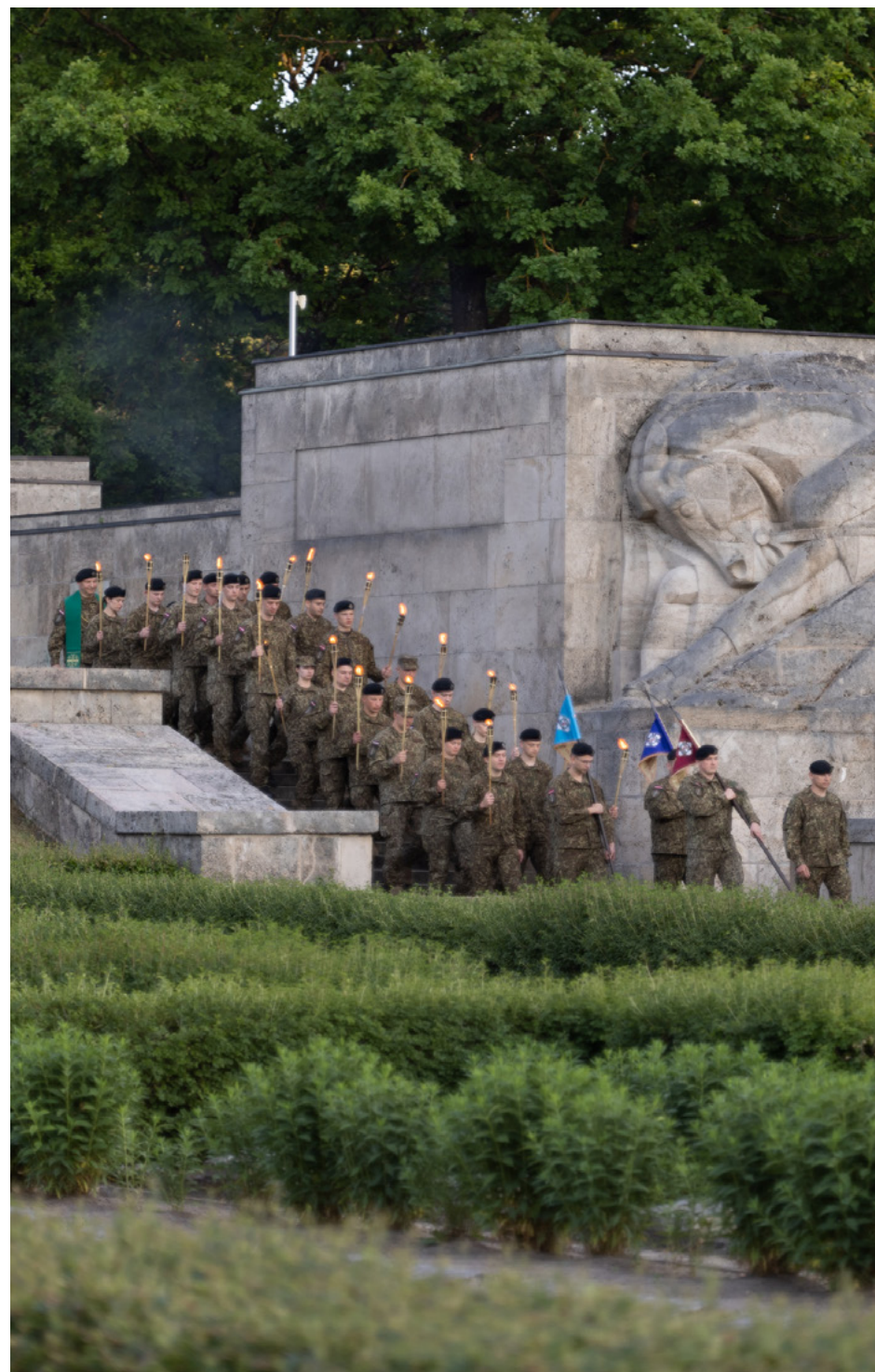
Virsnieka svinīgā solījuma došanas ceremonija Rīgas Brāļu kapos, 2023. gada 12. jūnijs